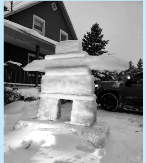
2e Mireille Ouellet