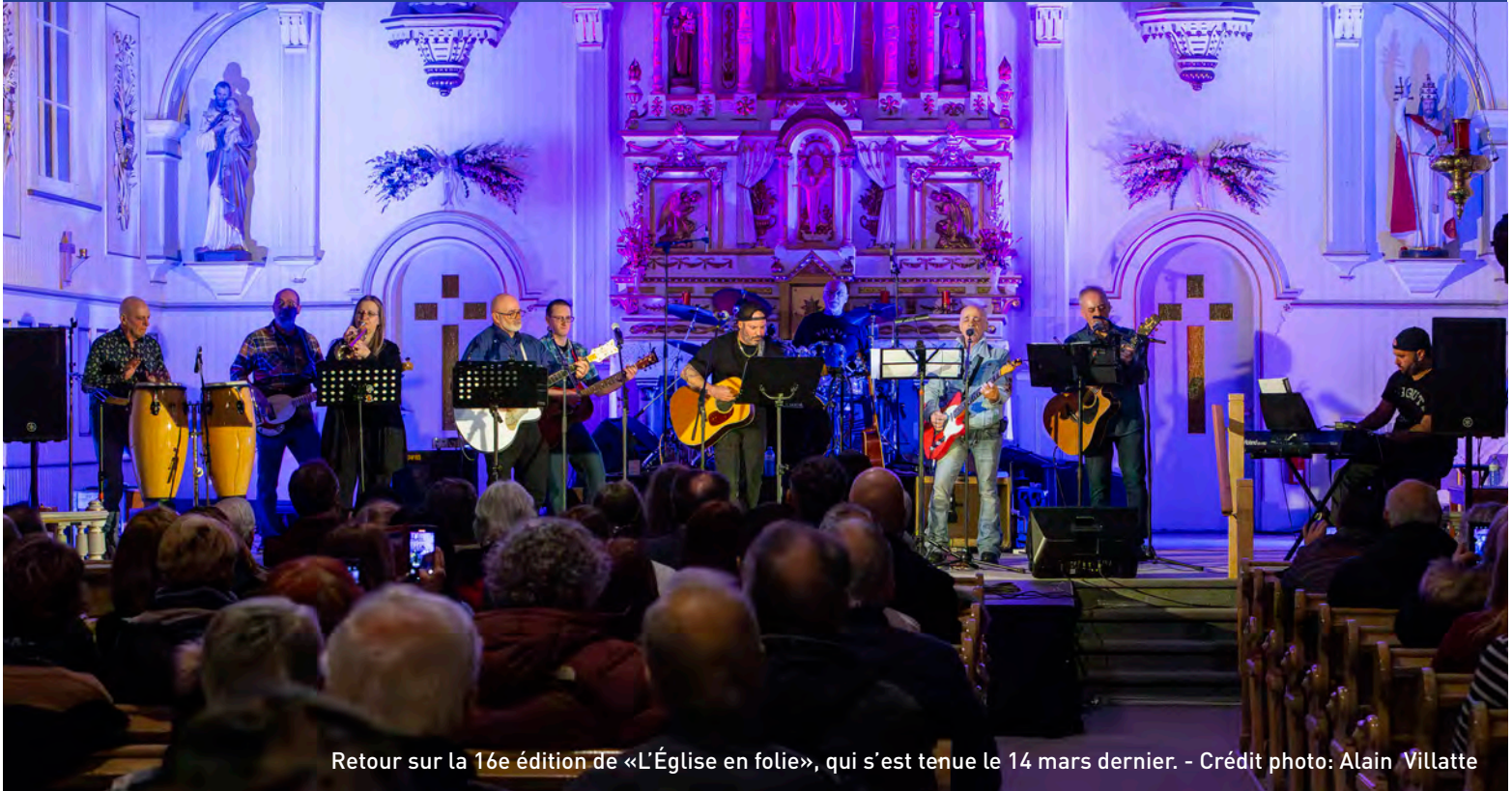
Retour sur la 16e édition de «L'Église en folie», qui s'est tenue le 14 mars dernier.